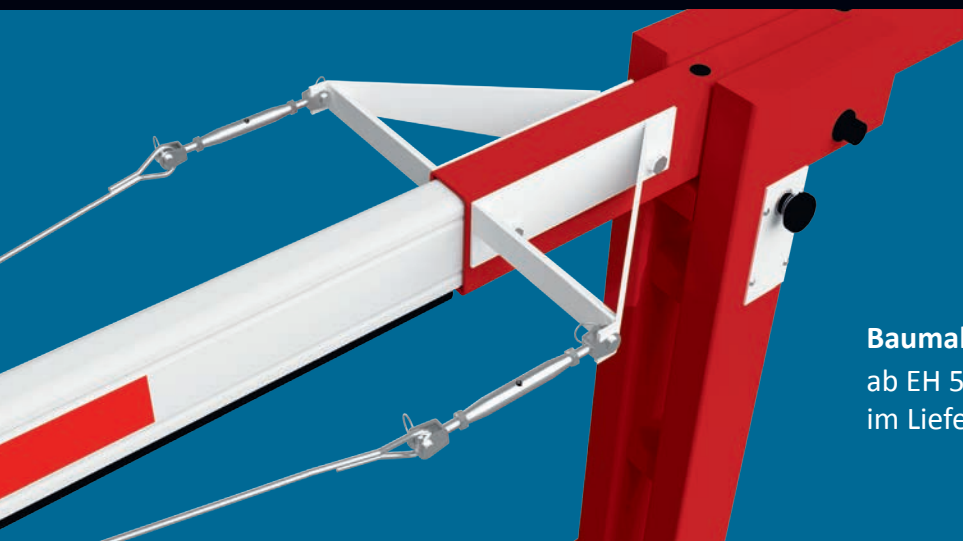
Baumabspannung ab EH 55L (5.500mm Sperrbreite) im Lieferumfang enthalten

*Ab EH 40L (4.000mm Sperrbreite) ist immer eine Pendelstütze oder ein Auflagepfosten erforderlich.