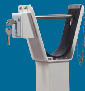
Profil-Zylinderschloss am Auflagepfosten (optional)