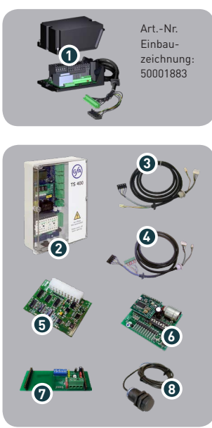
Art.-Nr. Einbau- zeichnung: 50001883